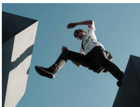
Zeigen Sie Engagement für Ihre berufliche Zukunft

Bewerben Sie sich jetzt für Promotion plus + qualifiziert