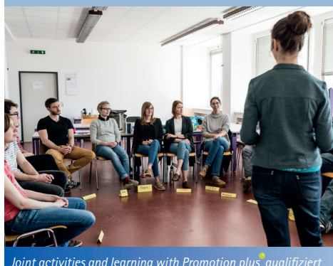
Joint activities and learning with Promotion plus + qualifiziert