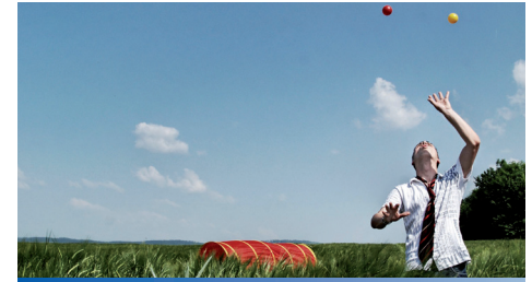
Promotion plus + qualifiziert geht in die 10. Runde

Den genauen Programmablauf finden Sie auf Seite 3. In Abhängigkeit von den weiteren Entwicklungen um das Coronavirus kann es zu