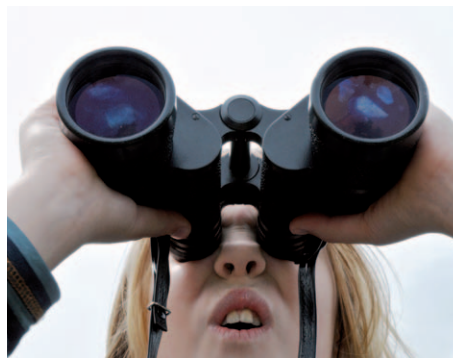
Verschaffen Sie sich einen Überblick

Eine Promotion ist eine spannende wissenschaftliche Herausforderung. Aber Forschung ist mehr als Recherche, Analyse und Interpretation. Es gilt, die Fragestellung zu strukturieren, Arbeitsschritte aufeinander abzustimmen und auf Kongressen die eigenen Ergebnisse zu präsentieren, bevor die Arbeit niedergeschrieben werden kann. Der Doktorand ist Projektmanager seiner eigenen Dissertation.